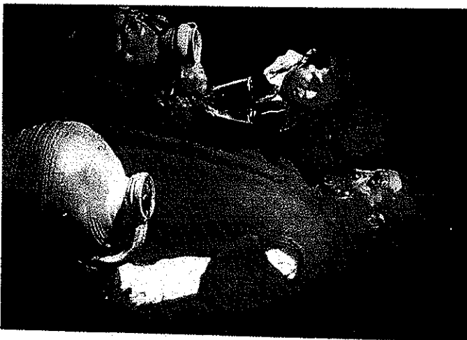
Lámina 3 Velázquez: El aguador de Sevilla.