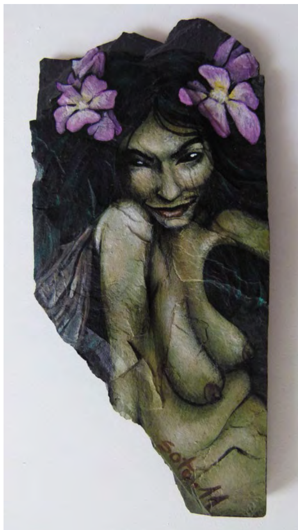
Hada verde, 2011 Acrílico sobre pizarra, 22 x 14 cm

Formada en la Escuela de Arte de Zaragoza en ilustración, escultura y animación, su preparación se completa con diversos cursos de artesanía, diseño de interiores y patronaje y confección. En 2012 su proyecto final obtuvo el Premio Extraordinario de la Escuela de Arte de Zaragoza. Hasta ahora ha desarrollado su carrera expositiva principalmente en la provincia de Zaragoza.