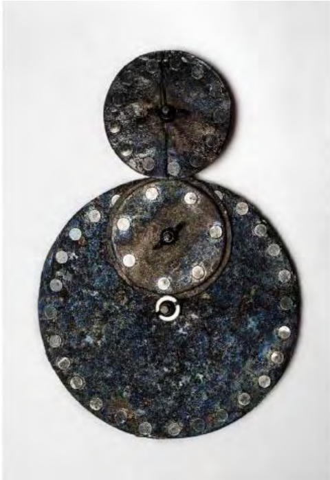
Ciclo Rojo , obra de Eloïse Louise