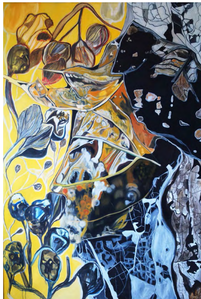
Cabeza pensante sobre fondo amarillo, 2004. Óleo sobre lienzo, 190 x 130 cm

Se formó en la Escuela de Arte de Zaragoza a finales de los noventa y después obtuvo su licenciatura en Bellas Artes en la Universidad del País Vasco. Completó su formación con estancias en Francia gracias a diversas becas y ha participado en varias exposiciones, tanto individuales como colectivas, principalmente en Aragón y el País Vasco.