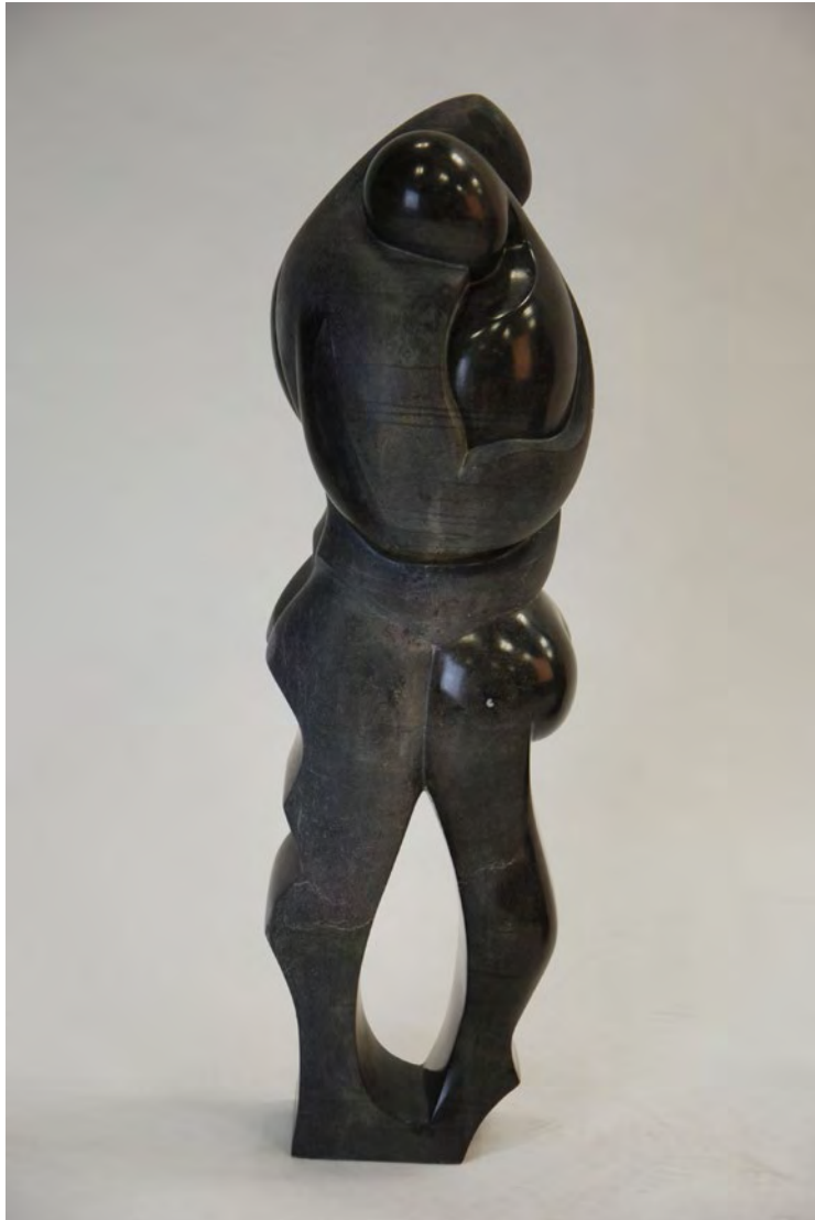
Abrazo, 2012 Piedra negra de Calatorao, 60 x 19 x 17 cm

Formada como especialista en escultura en la Escuela de Arte de Zaragoza, ha completado este trabajo con sus intereses por el diseño y por el cine en la especialidad de maquillaje y caracterización. Ha participado además en diversos certámenes y proyectos.