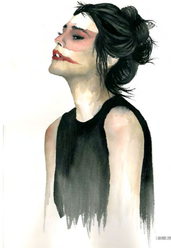
Rabia, 2018 Acuarela, 61 x 46 cm

Formada en la Escuela de Arte de Zaragoza en los primeros años del siglo XXI, se dedica fundamentalmente a la ilustración y ha colaborado con diferentes editoriales, además de trabajar como freelance para revistas y otros medios culturales. Combina su dedicación artística con el trabajo como profesora en cursos y talleres diversos y ha desarrollado una línea personal de skate art a base de skates reciclados en los que la figura femenina es la protagonista con una interesante revisión de los grandes iconos de la historia del arte.