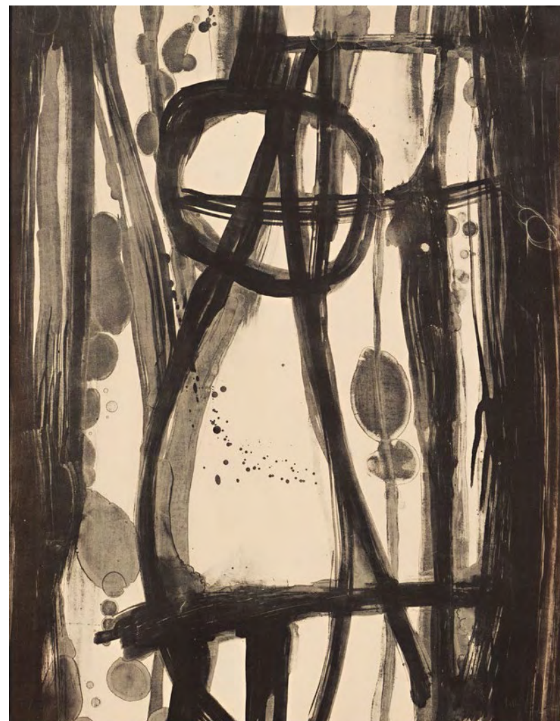
Citizen , 2010

En 1996 se tituló como ilustradora en la Escuela de Arte de Zaragoza y, recientemente, como técnico superior en grabado y técnicas de estampación. En abril de 2012 recibió el Premio Extraordinario de las Enseñanzas Profesionales de Artes Plásticas y Diseño, en la categoría de obra gráfica, con el que la Escuela de Arte de Zaragoza reconoce a sus mejores alumnos.