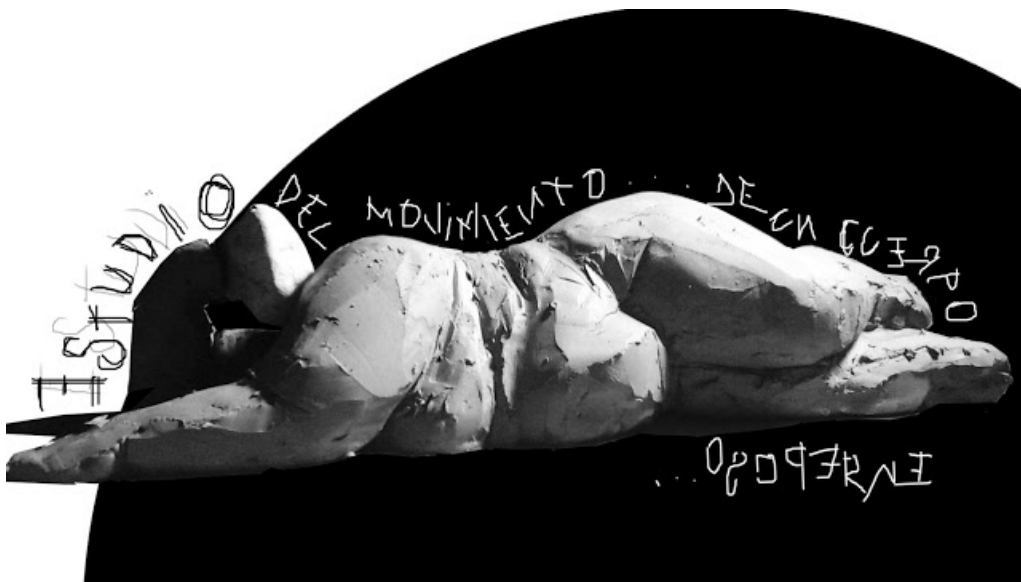
La Mujer de Barro. Estudio del movimiento de un cuerpo en reposo, 2016 Vídeo

Formada en dibujo académico en Pamplona y en producción audiovisual en Andoáin (Guipúzcoa), completó su formación en la especialidad de escultura en la Escuela de Arte de Zaragoza entre 2013 y 2016. Persuadida también por la pintura, la costura o el diseño, es una personalidad inquieta que continúa aprendiendo y probando experiencias a medida que avanza en su carrera artística.