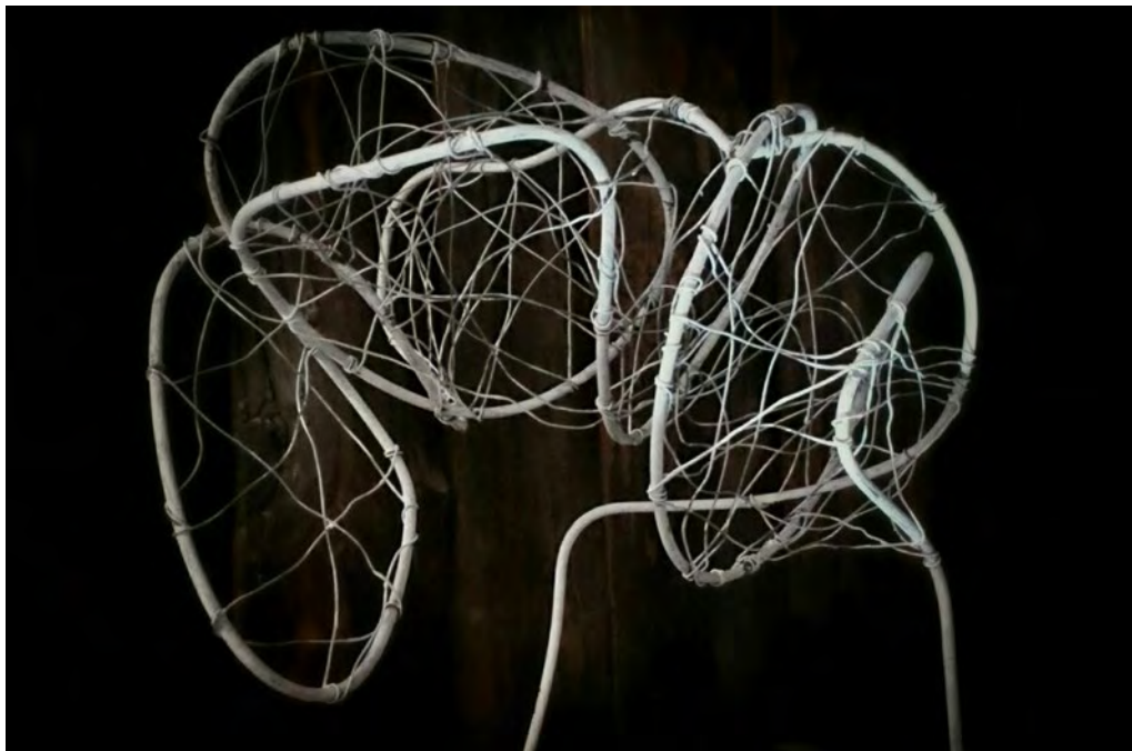
Abstracciones móviles, 2017

Tras aprender diseño de moda y el oficio de costura ha realizado diversos vestuarios. Aprendió a dibujar y a pintar al óleo en academias y por último obtuvo el título de técnico de escultura en la Escuela de Arte de Zaragoza. Ha desarrollado su carrera profesional y expositiva principalmente en esa ciudad.