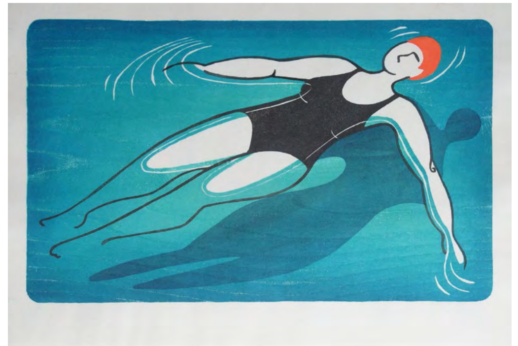
Estoy pensando, 2015 Mokuhanga (xilografía japonesa), 28,9 x 41,7 cm

Formada en la Escuela de Arte de Zaragoza en las especialidades de escultura y de grabado y estampación, dedicó gran parte de su labor profesional a las tareas de restauración de patrimonio para después dedicarse como grabadora a las técnicas de xilografía japonesa, para las que se especializó en Reino Unido y Japón. Hoy dirige en Zaragoza un taller y estudio de xilografía especializado en mokuhanga y desarrolla su carrera artística y expositiva.