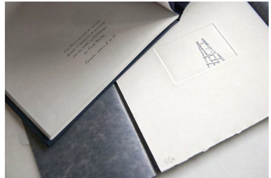
Neuma (libro de artista), 2016 Fotografía y grabado al aguafuerte, 22 x 20 cm

Es grabadora y estampadora. Obtuvo su titulación oficial en la especialidad de grabado y estampación en la Escuela de Arte de Zaragoza en 2009 y desde entonces ha continuado ampliando su especialización en prestigiosos centros de nuestro país, como la Fundación CIEC de Betanzos (A Coruña) o la Escuela Massana de Barcelona, y también fuera de España en Edimburgo y en Maryland (EE.UU.). Desde 2011 es responsable del proyecto El Calotipo, dedicado al diseño y estampación artística en la ciudad de Zaragoza.