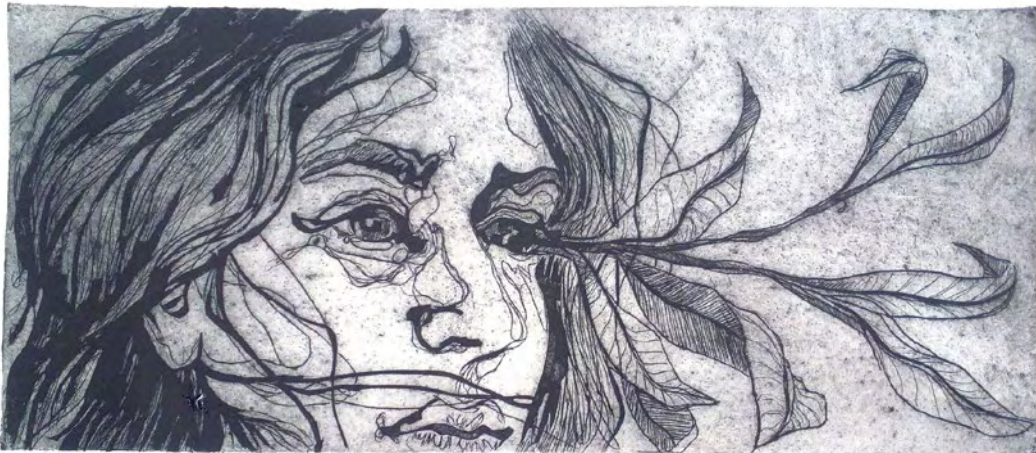
Cada una florece por donde quiere (si es que quiere florecer), 2017 Punta seca, 38,5 x 55,5 cm

Licenciada en Bellas Artes en la Universidad de Salamanca, completó sus estudios en Venecia y también en la especialidad de grabado y estampación en la Escuela de Arte de Zaragoza desde 2015. También se ha formado en diseño y ha participado en diversas exposiciones y certámenes tanto en Zaragoza como en otras localidades españolas, además de en Italia. La imagen de la mujer y su análisis en la sociedad contemporánea son la base de su trabajo.