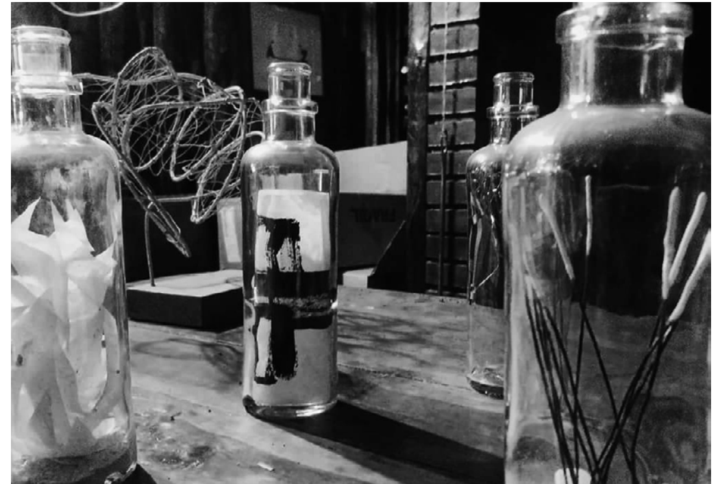
Diversas obras de Gema Beatriz

Encontramos, así, ahora aquí reunidas a un grupo heterogéneo de mujeres que, con diferentes propuestas, nos muestran su visión de la expresión artística de hoy en día; demuestran las diversas posibilidades para la creación artística actual y lo hacen con un discurso sólido basado en la formación, también diversa, y en la demostración tanto de su yo individual como colectivo dentro del mundo del arte de nuestros días. Aunque muy diferentes, todas comparten algún hecho significativo; nacieron en las últimas décadas del siglo XX y además, en algún momento de sus trayectorias, se formaron en la Escuela de Arte de Zaragoza, algunas incluso en periodos diferentes de sus vidas y sus carreras. Ciertamente tienen diversos orígenes geográficos y también diferentes destinos, porque están desarrollando sus carreras en lugares variados. Al revisar esas trayectorias podemos apreciar también el carácter inquieto que de nuevo las pone en común, pues observamos en ellas cómo